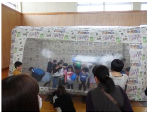
(子供たちも大喜び!新聞ドームとダンボール迷路)