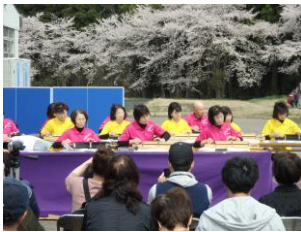
(桜をバックに大盛況だったステージイベント)

4月14日(日)に「さんわ桜の陣」が三和西部スポーツハウスで開催されました。今年は桜の満開と開催が重なり、当日の天候にも恵まれ、三和区内外から大勢のお客様にお越しいただき、三和西部工業団地の桜や三和の食、イベントを楽しんでいただきました。